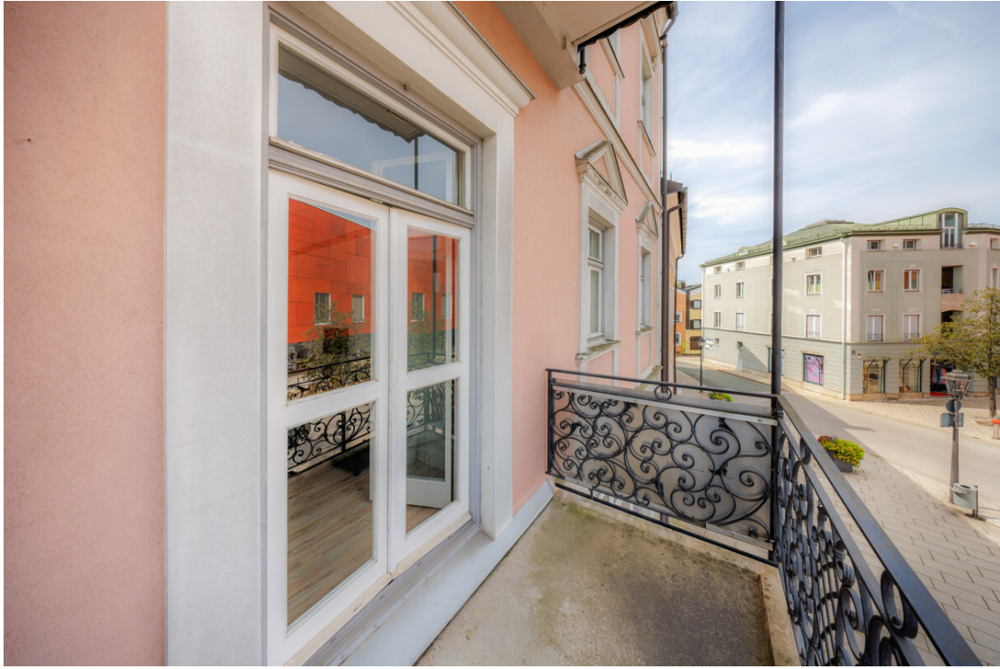
alkon mit Traumausblick