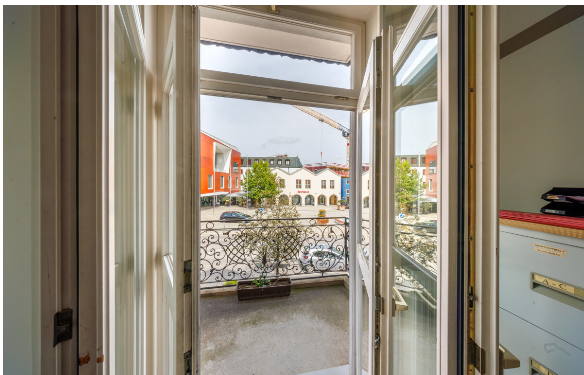
Balkon mit Traumausblick