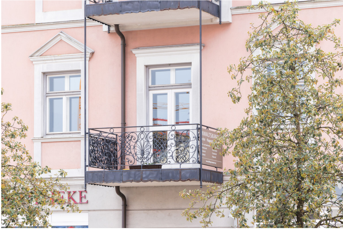
Balkon Büro 1.OG