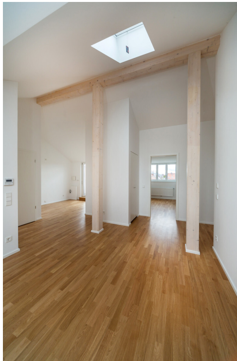
Zugang zu den Zimmern