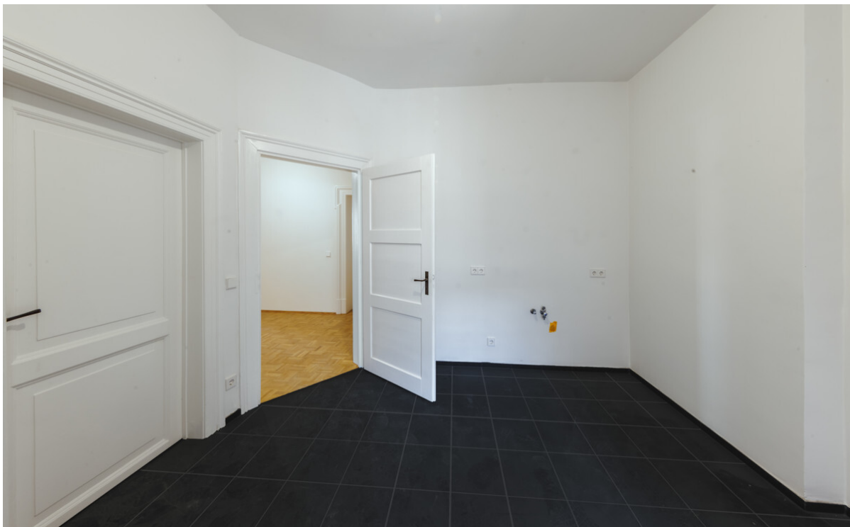
Küche mit Balkon