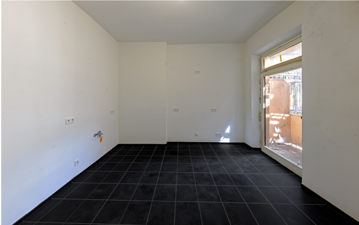
Küche mit Balkon