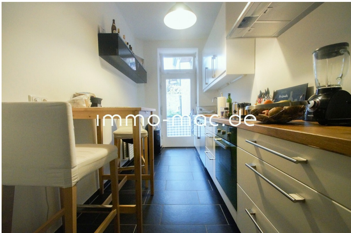
Küche Bsp. ohne Einbauten