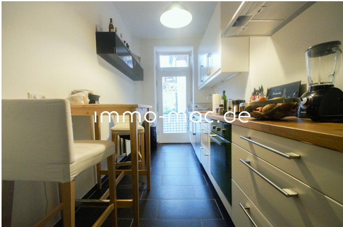
Küche Bsp. ohne Einbauten