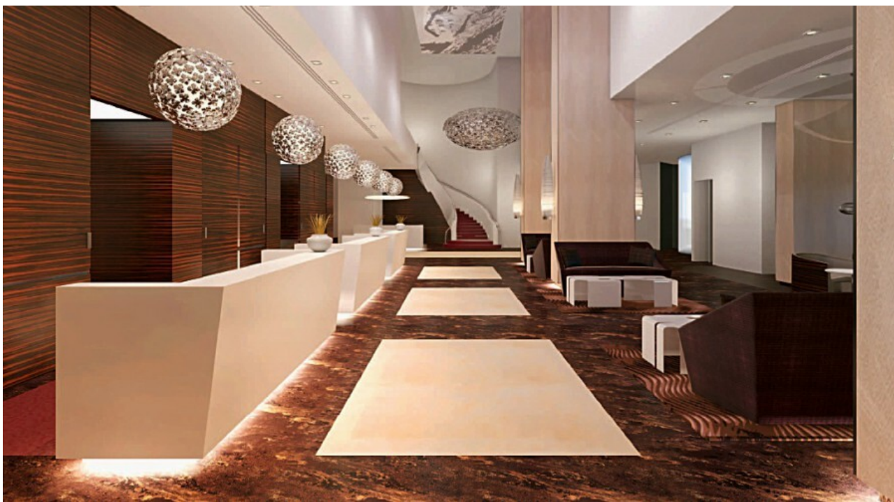
Stilvoll elegante Lobby