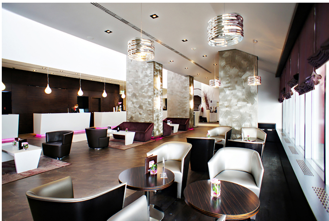
Stilvoll elegante Lobby