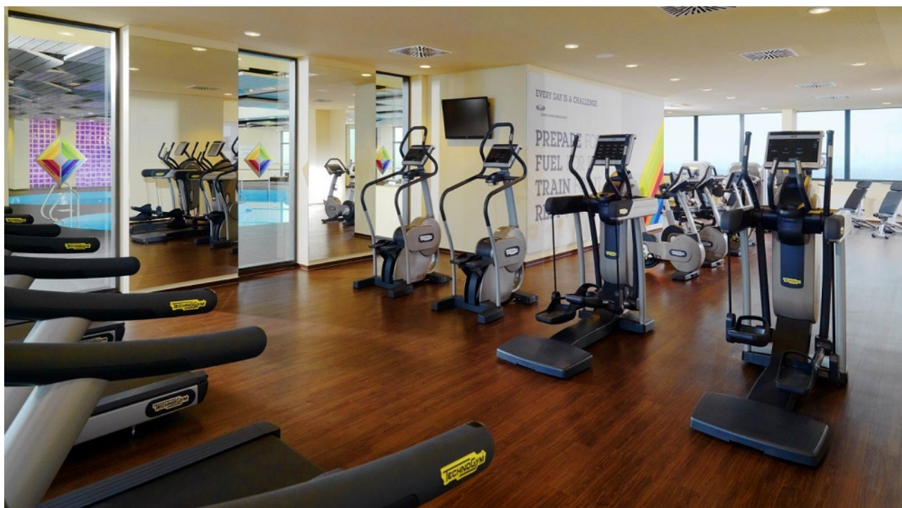
Fitnessstudio für Mieter