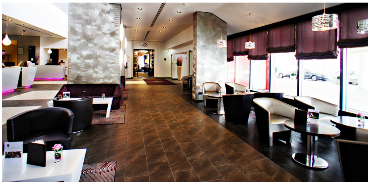
Stilvoll elegante Lobby