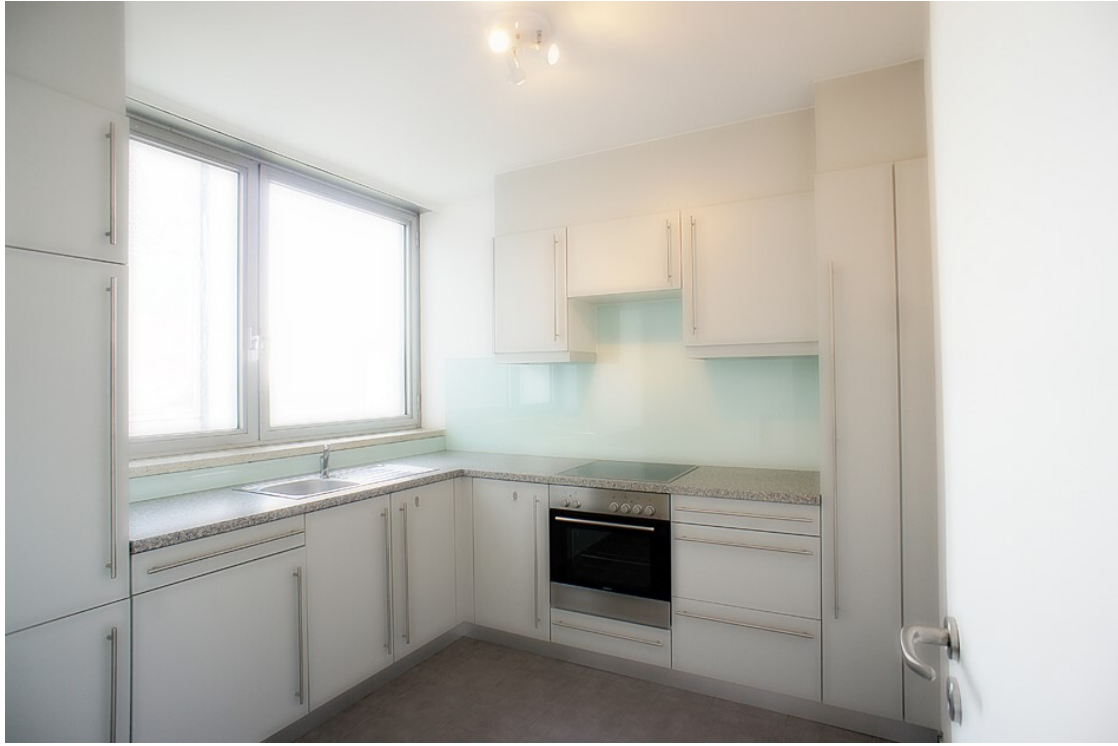
Küche ohne Einbauten