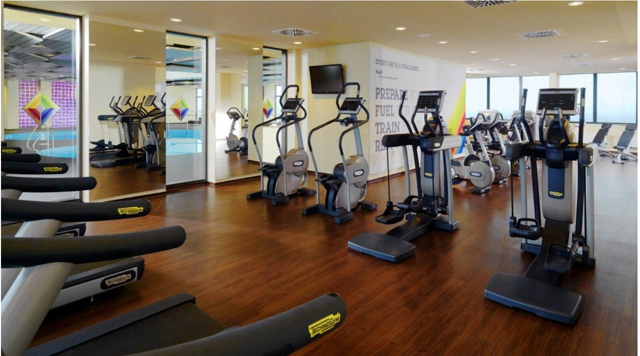
Fitnessstudio für Mieter