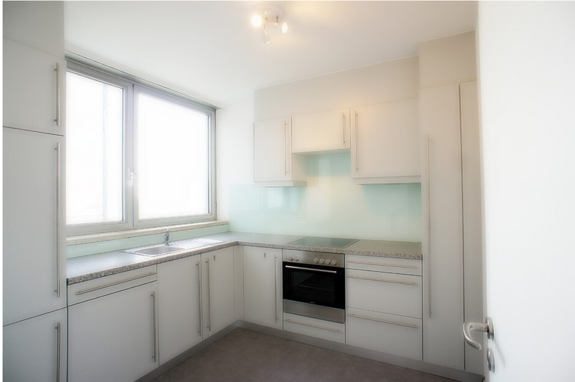
Küche ohne Einbauten