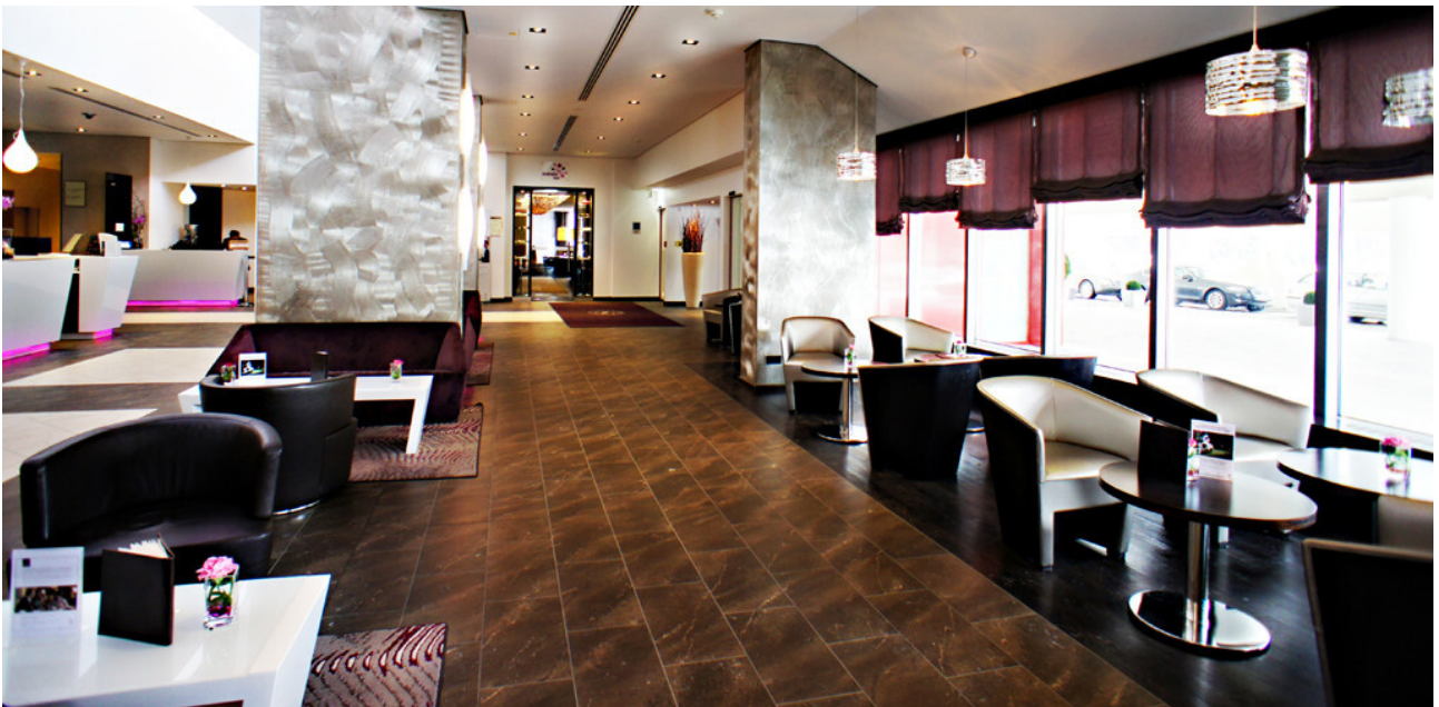
Stilvoll elegante Lobby