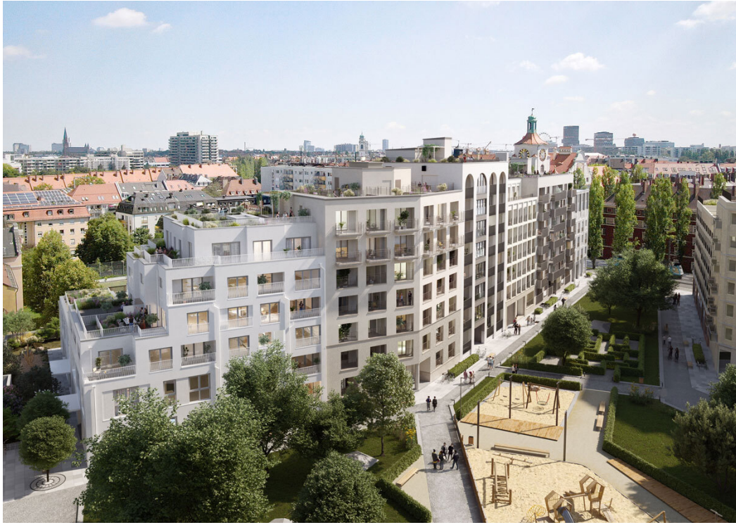
68_s4_cam03 - Copy