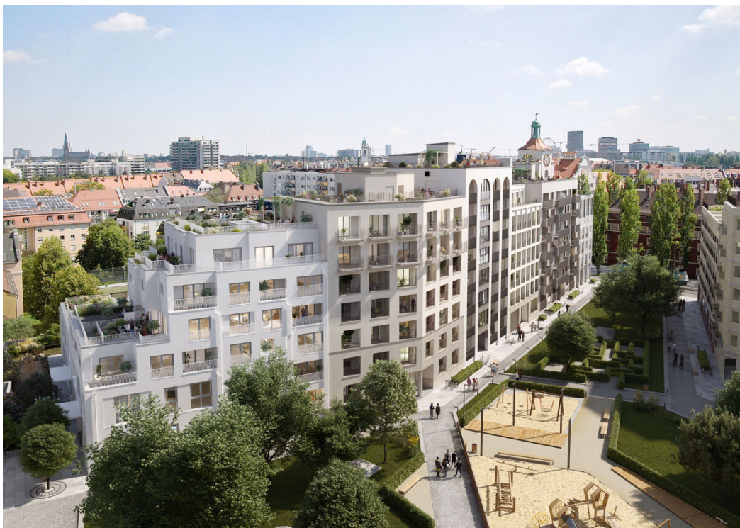
68_s4_cam03 - Copy